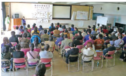
▲写真1: 2007年3月、神奈川県立三浦ふれあいの村で開催された「海辺の環境教育フォーラム2007」。NPO関係者、行政、研究者など、約80名が集った。

2001年3月、海の環境教育に関心を持つNGOや行政職員、水族館関係者など約80名が静岡県賀茂郡(現西伊豆町)に集まりました。当時、環境教育に関する全国集会はいつかあったのですが、海系の人の参加は少なく、情報交換の機会に限られていたこともあり、予想以上に熱気のある集まりとなりました。以降、石垣島、高知、沖縄島と場所を変えながら毎年開催されています。このミーティングを中心に、「ゆるやかなネットワーク」が海辺フォーラムの本体です。実行委員会は毎回ミーティング終了と共に解散してしまうので、ネットワークの維持と、ミーティングから産まれた協働事業の一部を運営するために、事務局を細々と運営しています。現在のところ、会員制度はありません。