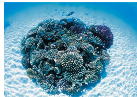
▲写真2: モルジブのサンゴ礁「OWS5人の写真展〜未来に残したい海〜」開催希望の協賛企業・団体募集中です。

今年10周年という節目の年を迎えるOWSでは、さらに活動内容の充実を図り、さまざまな分野の皆さんとの協働・連携を進めていきたいと考えています。とりわけ、サンゴ礁学会のみならず、各種の講演やフィールド活動、執筆などいろいろな面で、今後ともご支援・ご協力をお願いしたいと思います。どうぞよろしくお願いいたします。