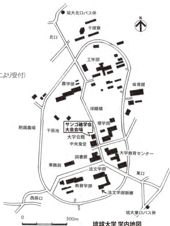
琉球大学 学内地図